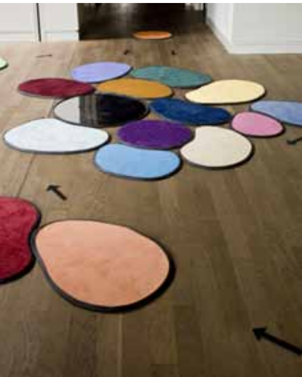
Constellation of Support Teppich, Gummi, Spiegel, gerahmter Digitaldruck 2011

»Das Selbst ist trotz seiner diffusen Bedeutung und prekären Unwirklichkeit eine zentrale Kategorie in der Analyse und Evaluation des modernen Menschen. Wohingegen die Leute früher noch den relativ statisch-passiven Begriff der Seele bevorzugten, um die Essenz einer Person zu umschreiben, hat das letzte Jahrhundert, beflügelt durch neue Wissenschaften wie der Psychologie, dem Selbst die Hauptrolle im Drama des alltäglichen Lebens übertragen. Für moderne Diskurse über das Selbst - angefangen von der Psychoanalyse bis hin zur New Age Spiritualität - repräsentiert das Selbst nichts weniger als die fundamentale Basis, das reflektiert-reflektierende Zentrum des Universums. Allerdings ist das Selbst dabei keine festgeschriebene Größe: Der alles entscheidende Faktor in der modernen Lehre vom Selbst liegt in ihrer Forderung nach Optimierung und Dynamisierung und dem damit einhergehenden Glücksversprechen. Die neuen Imperative lauten folglich: Finde dich selbst! Erkenne dich selbst! Sei du selbst! Verwirkliche dich selbst! etc. Diese Imperative gehen einher mit einer Vielzahl von Methoden und Praktiken, welche sich auf die Umsetzung genau dieses Versprechens von Harmonie zwischen Selbst und Umwelt spezialisiert haben.